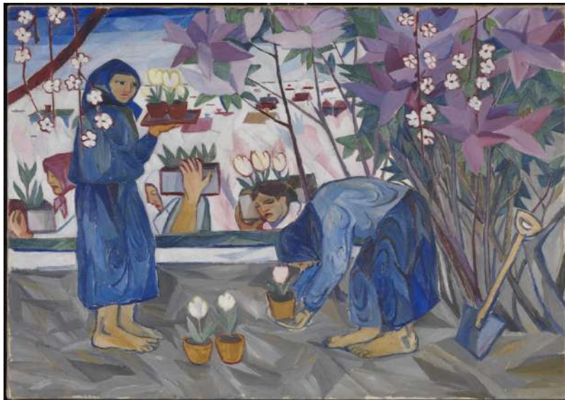
JARDINAGE , Natalia Gontcharova, 1908

Jean Blankoff 27 . De plus avec les crises économiques et politiques la demande pour l'art russe a pendant un temps disparu. Cependant, le secteur peine maintenant à trouver des travaux qui excitent les collectionneurs. L'art contemporain russe trop négligé en Russie, ne lui permet pas d'atteindre l'étranger, alors que pour de nombreux experts celui-ci est l'investissement de demain. L'art contemporain russe se bat pour trouver une véritable place sur le marché, car il est un moyen intéressant pour les marchands et les maisons de vente aux enchères pour relancer l'enthousiasme envers l'art russe.