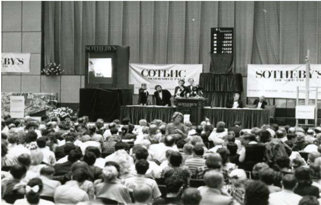
THE CROWD AT THE SOTHEBY'S AUCTION AT THE SOVINCENTR, MOSCOW, 1988.

A l'aide du catalogue d'exposition du musée Garage 12 nous savons donc que c'est donc en 1988, que se dessina un événement extraordinaire dans l'histoire de l'Union soviétique.