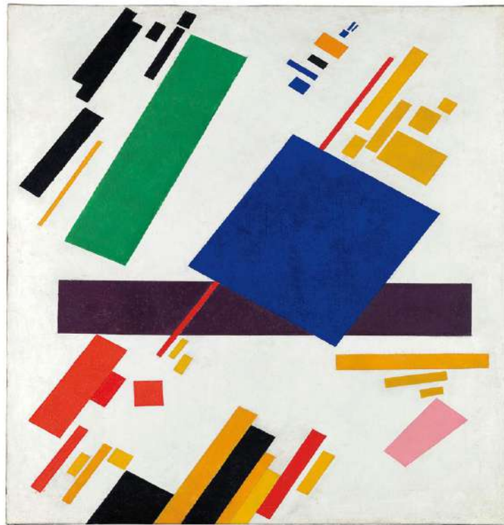
La toile Composition suprématisiste de l'artiste russe Kazimir Malevitch.

de vendre l'œuvre la plus chère vendue par un artiste russe, avec sa « Composition suprématisiste », toile qui date de 1916. Celle-ci a été vendue pour 59,96 millions dollars chez Sotheby's à New York en 2008. De plus, Malevitch réussit à battre son propre record sur cette catégorie car il s'élevait jusque-là à 17 millions de dollars. La « Composition suprématisiste » de Malevitch a donc été à la hauteur du marché global de l'art.