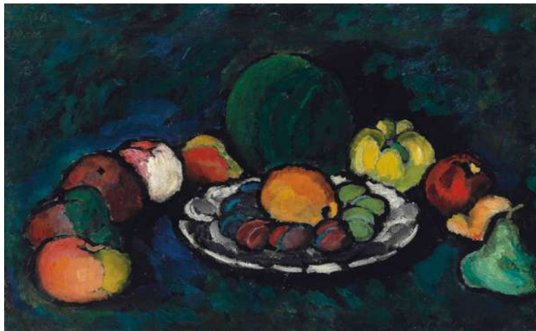
STILL LIFE WITH FRUIT, Ilya Mashkov

à Londres se porte bien. Londres ne perdra pas d'aussitôt le statut du site principal sur l'art russe. Durant cette semaine de l'art russe un total d'environ 108 771 776 livres sterling a été récolté sur la période 2013-2014 dont 21 millions de livre sterling ont été collectés pendant une semaine d'appels d'offres d'art russe en juin 2015, par les quatre maisons de ventes aux enchères : Sotheby's, Christie's, MacDougall et Bonhams. A titre de comparaison, le total des ventes aux enchères en Russie sur le marché intérieur des enchères en 2014 était d'environ 14 millions de dollars.