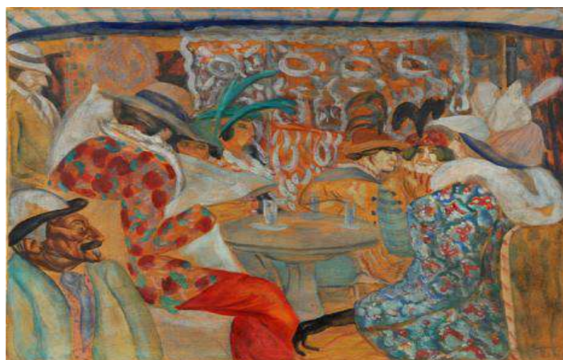
Au Restaurant , Boris Grigoriev