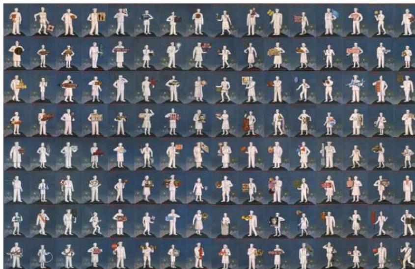
GRISHA BRUSHKIN, FUNDAMENTAL LEXICON, 1986.

Une autre question se pose donc à nous ; comment la vente allait-elle se dérouler et comment l'argent serait-il réparti ? La maison de vente aux enchères Sotheby's avait donc investi énormément d'argent pour cette vente, et il était convenu de partager les revenus de la vente de la manière suivante : 60% de la vente seraient perçus par l'artiste (ou ses héritiers, comme c'était le cas pour les œuvres de l'avant-garde russe), 30% seraient reversés au ministère de la culture de l'URSS et enfin les 10% restant seraient pour la commission de vente de la maison Sotheby's, qui, avait par la suite décidé de donner 2% des revenus, quelle avait touché aux fonds Soviétiques de la culture, dans le but de soutenir l'art russe et de sponsoriser des musées futurs. Tous les efforts fournis par la maison de vente aux enchères n'ont pas été vains car le chiffre d'affaire total de la vente a été monumental : il s'est élevé à £2,085 millions, de plus sur les 120 lots présentés à la vente, 113 ont été adjugés vendus soit l'équivalent de 94% des œuvres d'art, ce qui fut un excellent démarrage pour une vente aussi particulière. Nous pouvons citer la vente du tableau : « Фундаментального лексикона » de Grisha Brushkin qui est parti pour la somme de £242 miles, l'une des plus importantes ventes.