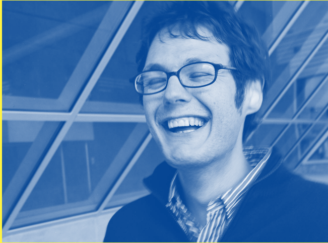
Ilya Kaminsky : parrain du festival