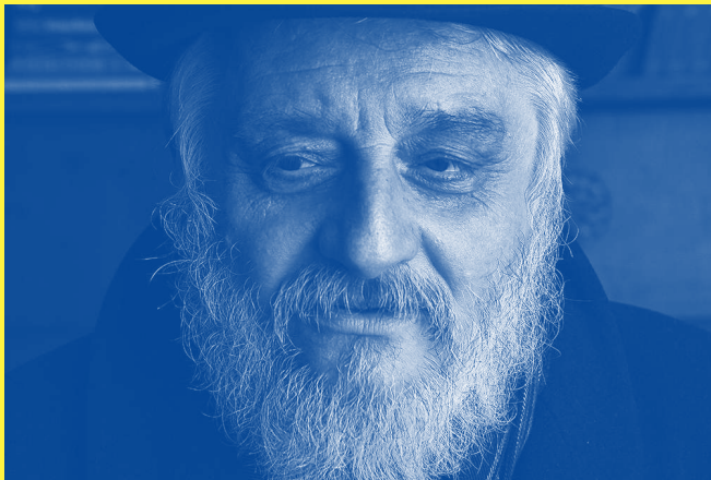
Boris Khersonsky : invité d'honneur du festival