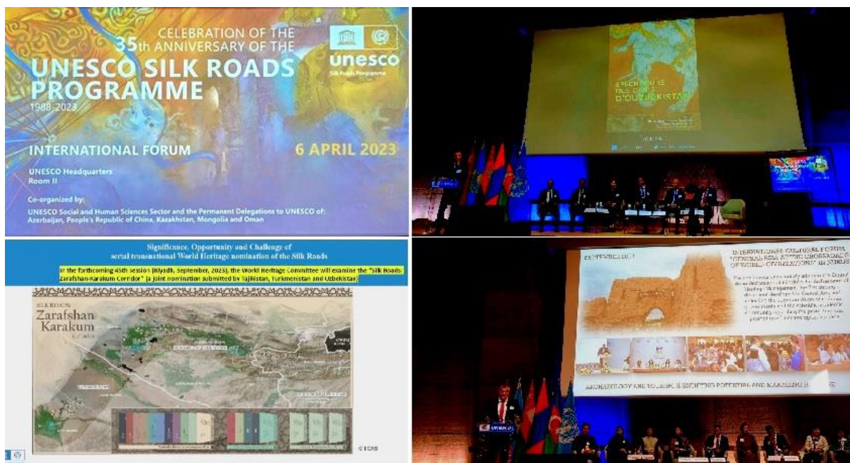
Image 4 : le 35e anniversaire de la création du programme Route de la Soie de l'UNESCO

Peter Frankopan , professeur à l'Université de Cambridge, a utilisé activement des images d'anciennes villes d'Ouzbékistan dans la présentation de ses recherches sur l'étude approfondie du patrimoine de la Route de la Soie.