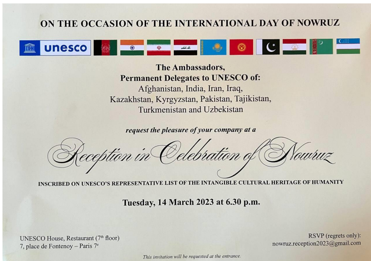
Image 2 : Invitation à la réception à l'occasion de la fête de Navrouz

culturel et diplomatique à Paris. Cette coordination a été facilitée grâce à la collaboration avec l'Ambassade d'Ouzbékistan à Paris.