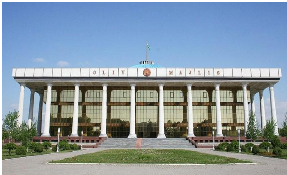
Oliy Majlis, parlement bicaméral ouzbek.

Le double enclavement - le pays ne possède pas de débouchés maritimes et est entouré de pays qui n'en ont pas non plus - de l'Ouzbékistan est un paramètre important dans la politique étrangère du pays, désireux d'être relié à des débouchés maritimes. La stabilité de l'Afghanistan est ainsi cruciale