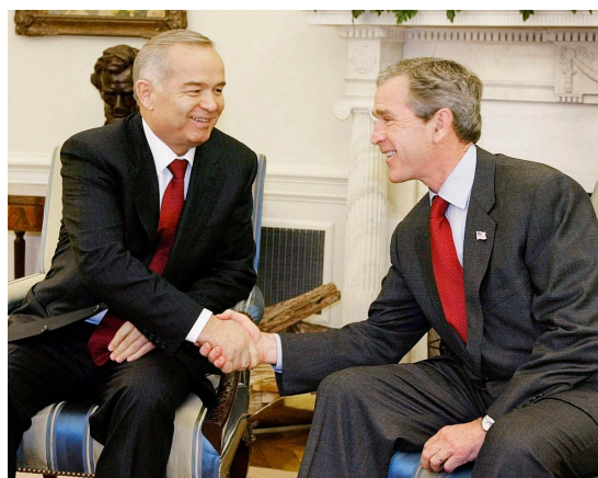
Rencontre entre George W. Bush et Islam Karimov.

Les relations entre l'Ouzbékistan et les États-Unis se sont matérialisées dès l'arrivée des États-Unis en Afghanistan, en 2001. Les États-Unis étaient doublement intéressants pour l'Ouzbékistan d'Islam Karimov, dans la mesure où ils représentaient une assistance dans la lutte contre le terrorisme, et une opportunité de se développer hors de l'égide de la Russie en tant que nouvel État indépendant.