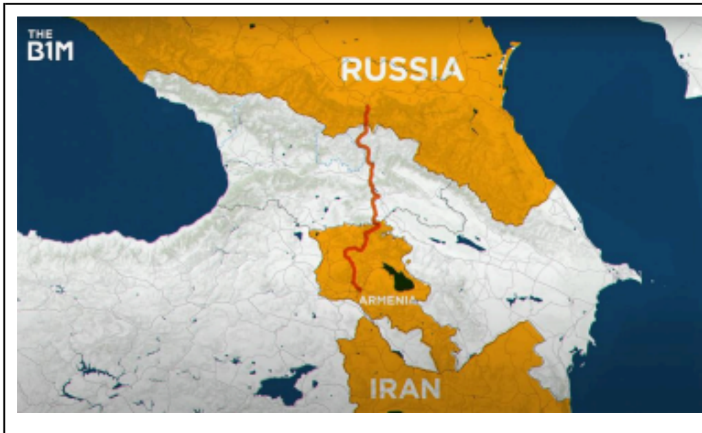
La route du corridor Nord-Sud qui relie l’Iran à la Russie 3

Après avoir investi dans les voies de communication de l’axe ouest-est, la Chine cherche donc à multiplier sa rentabilité en offrant une meilleure connexion entre le sud et le nord du Caucase, entre l’Iran et le couloir sud, et la Russie. Ce corridor est vital pour la Géorgie, dont une bonne partie du PIB dépend toujours du commerce avec la Russie, mais aussi pour l’Arménie, qui disposera ainsi d’une voie plus rapide vers la Russie dont elle dépend également.