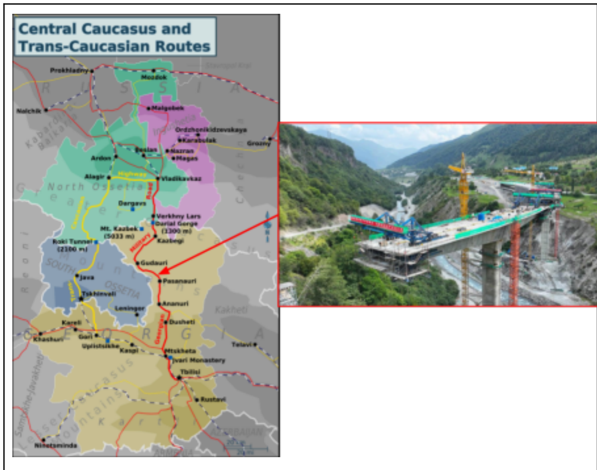
Route militaire Géorgienne 1

En arrivant par la “Route des envahisseurs” (ou des marchands, c’est selon votre degré d’optimisme), vous pouvez observer cet immense ouvrage au bord d’une route dans un état assez dégradé dû aux intempéries hivernales et au manque d’entretien. Les grues, les camions et les engins de chantier comportent tous des écritures chinoises, signe de la présence du maître d’ouvrage, le China Railway Tunnel Group , et d’un financement en grande partie assuré par la Banque Asiatique de Développement, ainsi qu’en moindre partie par la banque européenne pour la reconstruction et le développement.