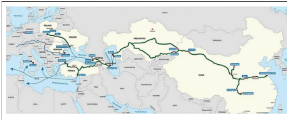
Le “Middle corridor” de la stratégie des Nouvelles Routes de la Soie 5

La Chine semble donc avoir bien en tête cette idée de plaque tournante du commerce dans un Caucase rempli de tensions, et son choix de la Géorgie comme pôle central est désormais proche d’être confirmé. Cela permettrait un couloir central de passage, entre la route du nord passant par la Russie et le sud par l’Iran, offrant une option plus sûre pour les investisseurs. Cela permettrait un couloir central de passage, entre la route du nord passant par la Russie et le sud par l’Iran, offrant une option plus sûre que possible afin d’acheminer vers l’Europe des flux massifs de biens manufacturés en Asie, sans laisser les adversaires de l’Occident avoir un contrôle sur ces flux. Le pont et le développement de la route nord-sud géorgienne servent ainsi de voie alternative, diluant le risque pour les investisseurs, augmentant la rentabilité et permettant des communications plus fluides à toutes les échelles géopolitiques.