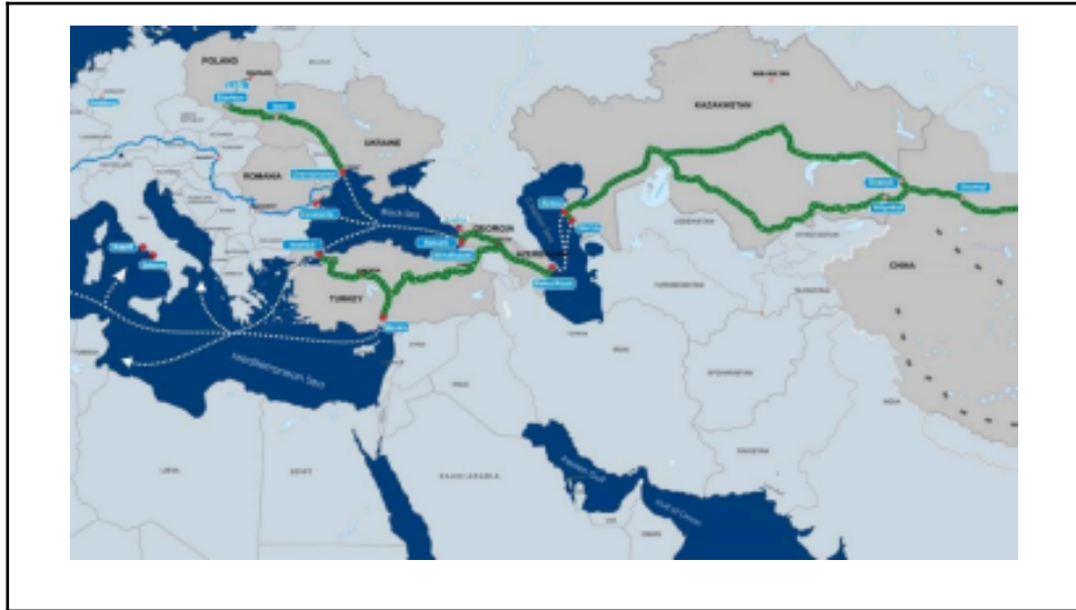
Carte représentant la potentielle voie de communication voulue par la Chine dans le Caucase sud 4

S'inscrivant dans une logique de “couloir du milieu” (middle corridor), la Géorgie est une porte géographique de passage entre les mers Noire et Caspienne. Entre le géant russe et l'instable Iran, elle offre une voie de transit plus sûre pour les biens et les personnes, donnant aux pays situés à ses voisinages est et ouest une opportunité fiable pour leur commerce international. La route nord-sud permettrait quant à elle d'en faire le centre d'un hub international de commerce entre les quatre points cardinaux, à travers le Caucase.