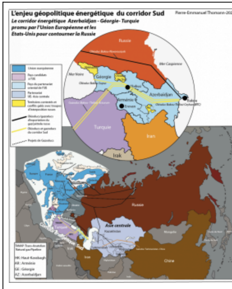
“L'enjeu géopolitique énergétique du corridor sud”, P-E THOMANN 7

Enfin, sur la scène géopolitique globale, cette dernière carte nous montre les enjeux de pouvoir qui se jouent dans cette zone. En étant que haut lieu du transit des hydrocarbures vers une Europe dépendante, le développement de ces pays contribue à assurer la sécurité énergétique de la région ainsi que du vieux continent, qui ne voit pas d'un mauvais oeil la stratégie chinoise. De plus, la Chine, elle aussi dépendante des hydrocarbures principalement russes via Power of Siberia 1, pourrait à terme envisager l'accès aux hydrocarbures azéris par la mer Caspienne, si toutefois la Russie venait à perdre pied sur l'échiquier géopolitique mondial.