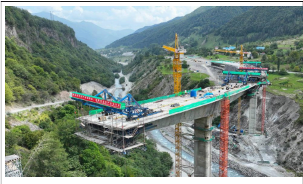
Le pont cité ci-dessus, point de départ de ma réflexion

Lors de mon premier séjour en Géorgie en 2025, en allant quelques jours dans les montagnes de Kazbegi, notre marshrutka est passée à côté d'un immense ouvrage, accompagné d'une multitude de camions, de préfabriqués et de panneaux comportant des inscriptions principalement en chinois. Cette scène m'a amené à me poser la question de la place de la Géorgie dans la stratégie des nouvelles routes de la soie et des investissements qui y sont liés sur le territoire kartvélien. Regardons donc ce que les cartes peuvent nous dire, en partant de ce pont vers le nord de la Géorgie, en regardant la situation à plusieurs échelles.